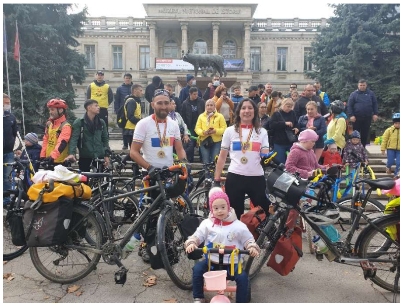
Marathon vélo inclusif, Chisinau (Moldavie)