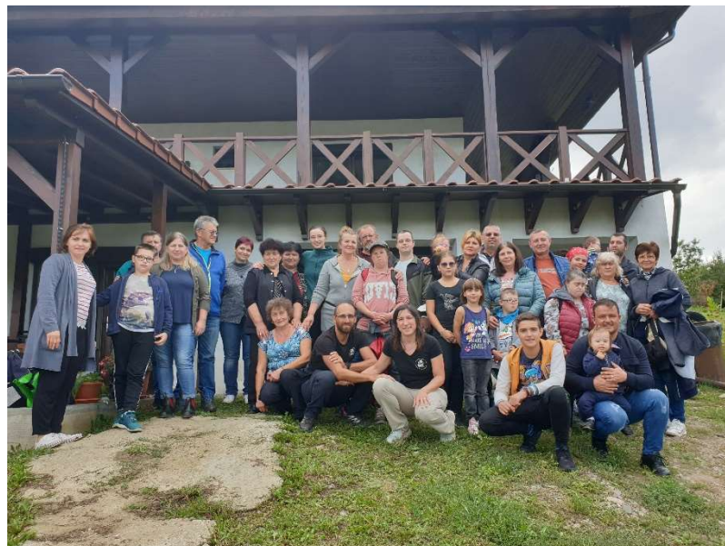
Rencontre de 3 associations de parents autour de la Trisomie 21, Cluj-Napoca (Roumanie)

- Associations autour de la Trisomie 21 : « Trisomie 21 » Bouches du Rhône, Creuse, Loiret, Côte d'Or et Franche-Comté, « Autour de Lou » à Nevers (France) ; Downovsyndrom à Bratislava (Slovaquie) ; « APCSDC » , « DownCer » et « Happyatoys » à Cluj-Napoca, « Down Bucuresti » à Bucarest et « Down Art Therapy » à Târgu-Jiu (Roumanie) ; « Sunshine » (Moldavie), « Turkiye Down Sendromu » à Istanbul (Turquie),