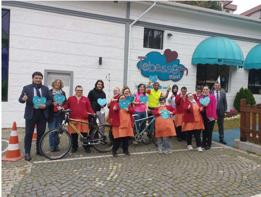
Tebessum Kahvesi, Istanbul (Turquie)

Exemples de familles avec un enfant trisomique dans lesquelles nous avons été accueillis :