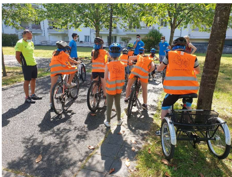
Présentation du projet et animation vélo – Ecole Le Renard et la Rose, Orléans