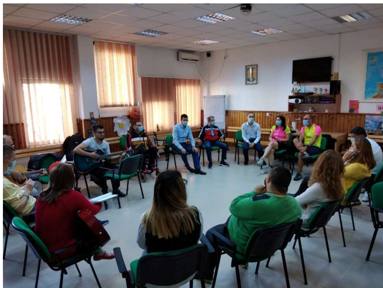
Présentation du projet – Centre d'accueil chrétien de Târgu-Jiu (Roumanie)