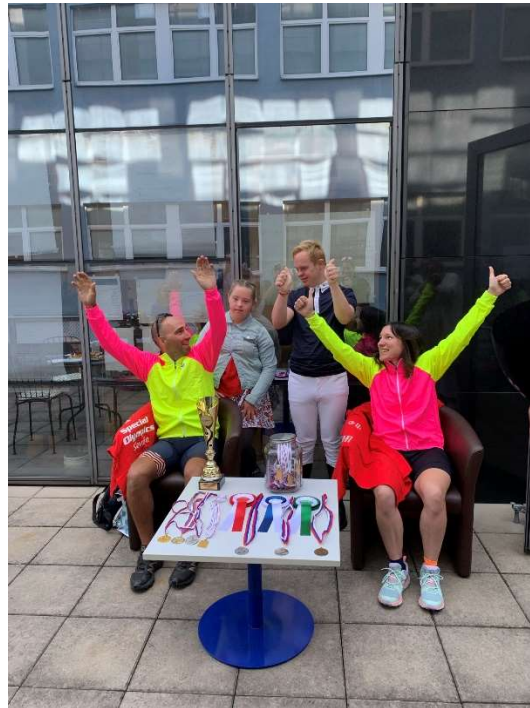
Rencontre avec des athlètes de Special Olympics – Bratislava (Slovaquie)

- Associations de sport adapté : « L'Eclaircie » à Vineuil (Loir-et-Cher), Fédération Française du Sport Adapté (FFSA - bénévoles au championnat d'athlétisme indoor à Nantes - mars 2021), « Nîmes Sport Santé », « l'Avi Sourire » à Marseille, « ATHOM » à Avignon, FFSA du Loiret, « Le Soleil Brille pour Tout le Monde » à Vernierfontaine (Doubs) ; « Special Olympics » (Slovaquie, Roumanie et Moldavie),