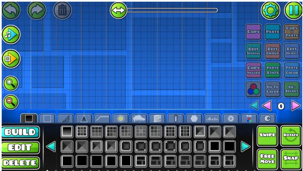
Une image de l'éditeur pour créer des niveaux